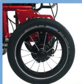
12"-Rad als Alternative zu 20", 22" oder 24"

Alle Ausstattungsmöglichkeiten finden Sie auf dem Bestellblatt des entsprechenden Rollstuhls