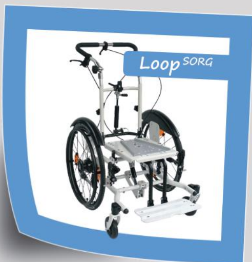
Das mitwachsende Sitzschalen-Untergestell

Mitwachsende Kanteelrollstühle und Sitzschalenuntergestelle Positionierung neu gestalten