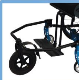
Lenk- und Schiebehilfe