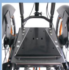
Sitzschalenadapter mit Keilaufsatz (nur für Loop SORG )