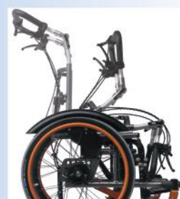
Rücken komplett umklappbar