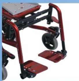
Abschwenkbare und abnehmbare Beinsätze