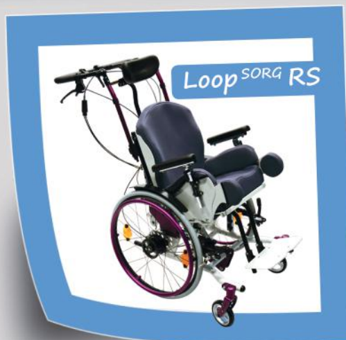
Kanteelrollstuhl für die individuelle Positionierung